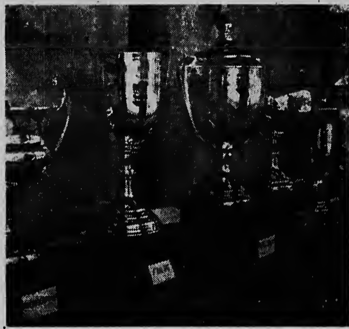
Den etalage di Kan N.V. den Nassaustraat na Oranjestad na e momento aki ta exhibi e diferente bekernan cual e firmanan y organisacionnan a pone disponibel pa e ganadornan di e racenan di auto riba Prinses Beatrix Vilegveid dia di La Reina.